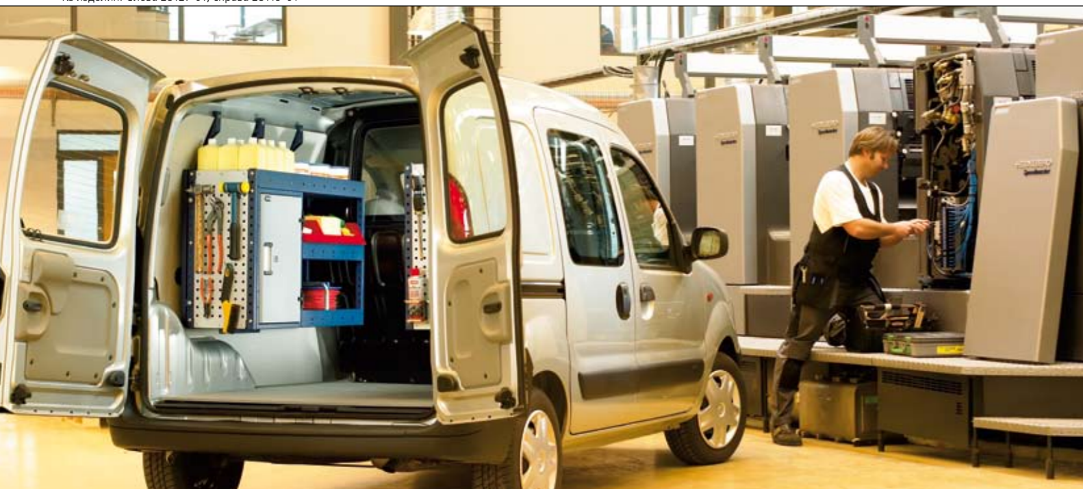
№ изделия. Слева 28232-01, справа 28245-01