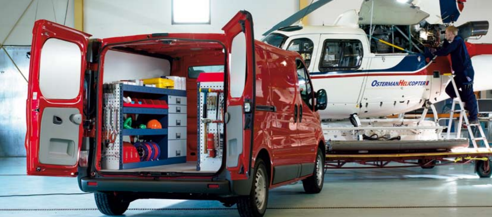
№ изделия. Слева 28093-01, справа 28079-01