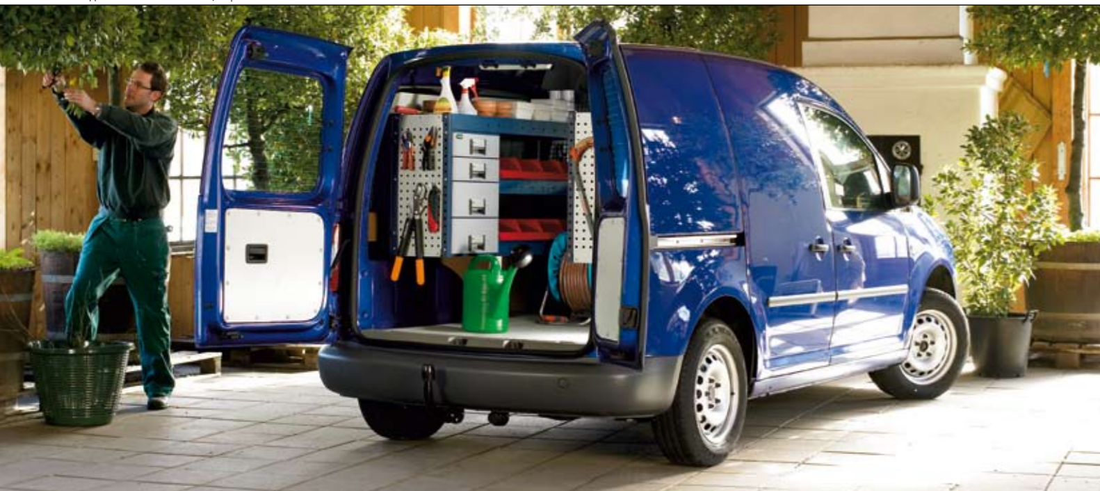
№ изделия. Слева 28127-01, справа 28119-01